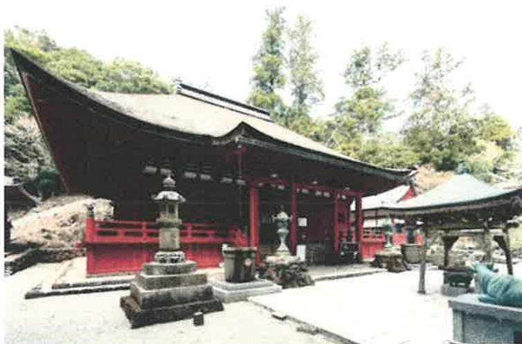
金剛證寺（こんごうしょうじ）〈三重県伊勢市〉