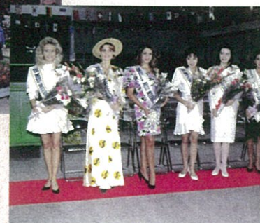
美との競演、ミスインターナショナル