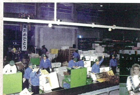
祝開場、気合いも入る初せり