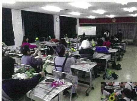
大人気、花をくらしに活かす出前講座