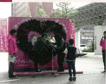
性がお花で告白、フラワーバレンタイン