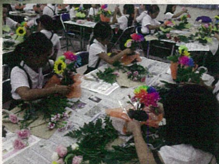
小学生がチャレンジ、花育教室