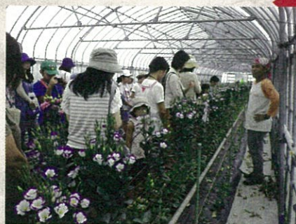
初体験、親子で産地見学