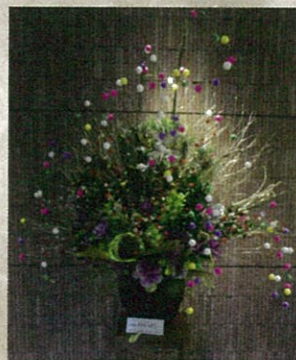
身近に花を、図書館で展示