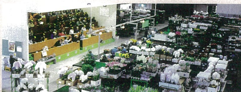
花いっぱい、活気あふれるせり光景