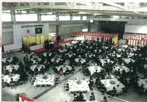
感慨ひとしお、華やかに開場