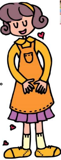
～かわいいおひなさまができたよ♡～

1年間ありがとうございました 今年度は延べ、 291名 の親子連れが遊びに来てくれました。 * 保育園や幼稚園に通っていないお友だち!! ポッポクラブに遊びに来てね♪