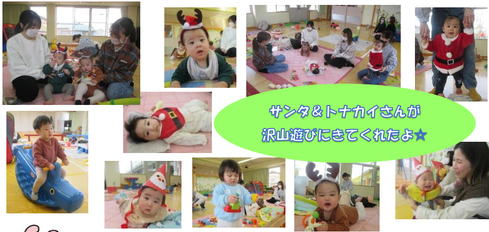
サンタ&トナカイさんが 沢山遊びにきてくれたよ☆