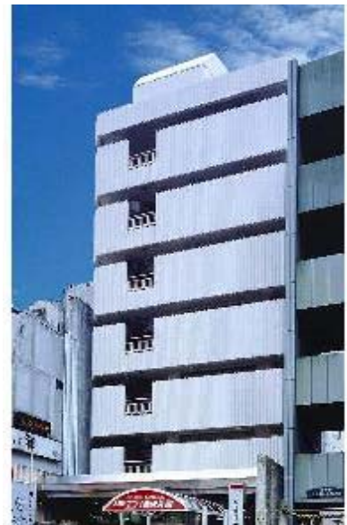
繁華街片町の中心地