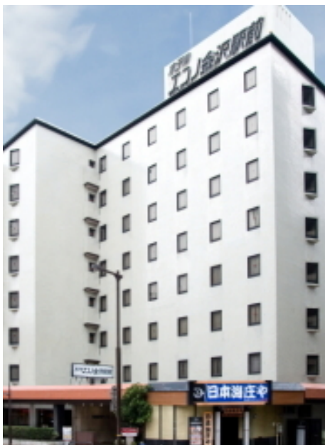
金沢駅より徒歩3分