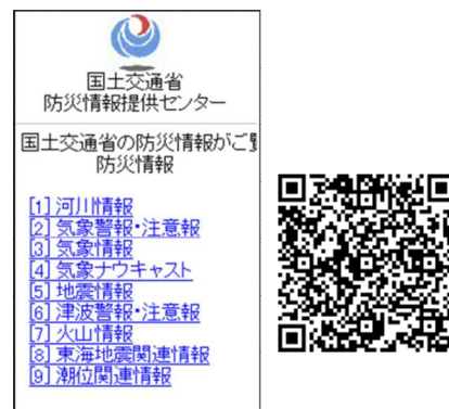
防災情報提供センター 携帯端末向けホームページ (Top)

http://www.mlit.go.jp/saigai/bosaijoho/i-index.html