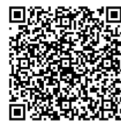
火山登山者向けの 情報提供ページ

(噴火速報の説明： http://www.data.jma.go.jp/svd/vois/data/tokyo/STOCK/kaisetsu/funkasokuho/funkasokuho_toha.html )