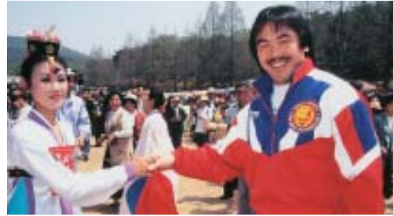
■その4 北朝鮮平壤...政治に目覚めた衝撃的な訪問