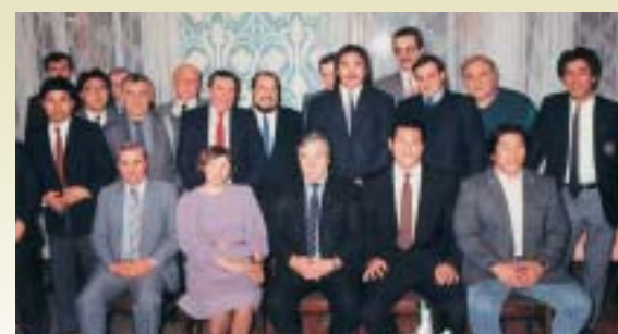
■その1 ロシアモスクワ...ベレストロイカの象徴。ロシアのスポーツ世界戦略(外貨獲得)の一つでもあった