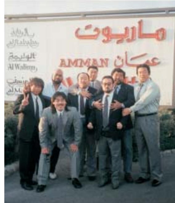
■その3 イラクバグダッド...人質解放に貢献