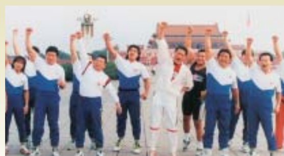
■その2 中国天安門...中国史上初のプロレス興行開催